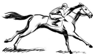
A barbada do Saudoso: Lord Gold

Marcação do Saudoso: IN FACT(6) – JACKSON POLLOCK(2) – MADERO(9).